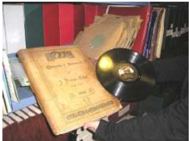
Detall del Fons de la FMTC