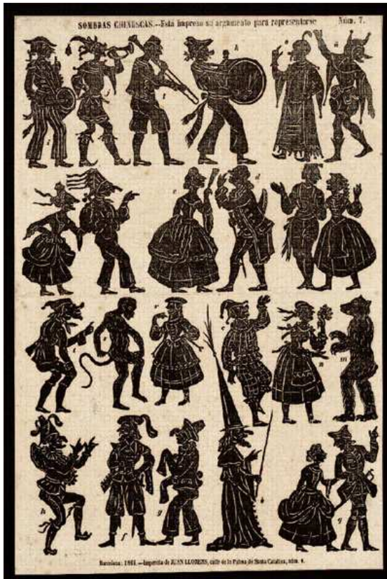
Exemple d'imatgeria popular : Ombra xinesa.