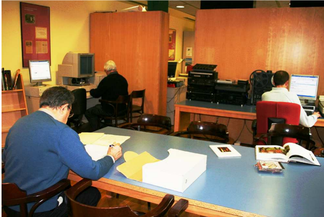
Detall de la sala de consulta.

Als inicis del s. XXI la documentació ha esdevingut quelcom més que acumulació i conservació de documents; s'ha convertit en un símbol ja que documentar cultura esdevé cultura en sí mateix i referma una voluntat de conèixer, projectar i facilitar la transmissió cultural i el diàleg intergeneracional. En aquest sentit, l'Arxiu de Patrimoni Etnològic del