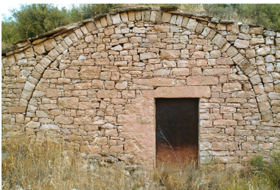
Cabana de volta vista, inserida al marge. Construcció de pedra seca. La Mora (Segarra).

hem de recordar la funció de refugi que van prestar moltes cabanes al temps de la guerra. No és estrany trobar testimonis d'aquest fet. En una cabana, prop de Tàrrega, m'explicaven: "aquí, quan la guerra, van amagar-se molts dies disset persones, entre gent gran i canalla, que eren quatre famílies senceres". Si la cabana quedava dissimulada, com ho són moltes de volta, no hi havia perill, però si es veien a camp descobert, podien ser atacades per l'aviació, com es va donar efectivament.