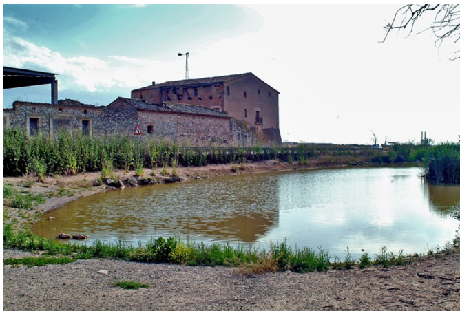
Bassa de la mateixa masia.

vegades bastant lluny. Més humils eren els masos, amb la casa de pagès i una tanca sovint elevada que delimitava el corral. També eren habitats tot l'any. Les construccions on es vivia temporalment ja eren cabanes que podien ser com a casetes de dos pisos, molt comuns a les terres de Lleida, o de menor envergadura. Cap a la zona d'Agramunt es pot observar encara com moltes d'aquestes