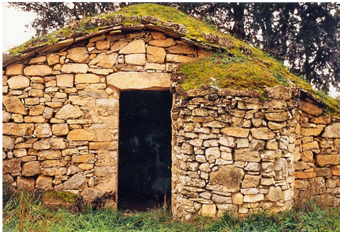
Cabana de volta tapada amb cisterna. Construcció de pedra seca. Verdú (Urgell).

A gran part del territori, la presència de cabanes es manté en una densitat tènue, que no deixa de cridar l'atenció, amb un punt d'anacronisme i humilitat davant les construccions modernes, magatzems, granges i grans pallisses, que ens informen de la seva presència desafiant un paisatge, al qual no ajuden gaire. La instal·lació d'aquestes estructures prepotents ens diu que s'ha girat un full de la història. Que s'ha deixat enrere, perduda en els temps dels nostres avis, una forma generalitzada de viure i de treballar la terra. Una terra a la qual pertanyien unívocament els seus habitants, i un paisatge fet un jardí de camps de cultiu, entre parets i cabanes on encara es pot contemplar, apreciablement endreçada, la mateixa pedra, la mateixa terra i la mateixa herba que es troba pels camps, puntejats discretament de fileres d'arbres. Aquestes formes construïdes configuren un paisatge pròpiament rural, on cada element té una lògica, on cada peça va allà on podia anar, i que quan s'esfondra per abandonament, retorna al mateix tros de terra d'on van sortir. Altra cosa són els enormes magatzems i pallisses, amb les seves cobertes metàl·liques, arribades allí en algun tràiler, i encara moltes granges, com a segments de ferrocarril ancorats pels afores, que fan impossible aquella foto panoràmica del poble.