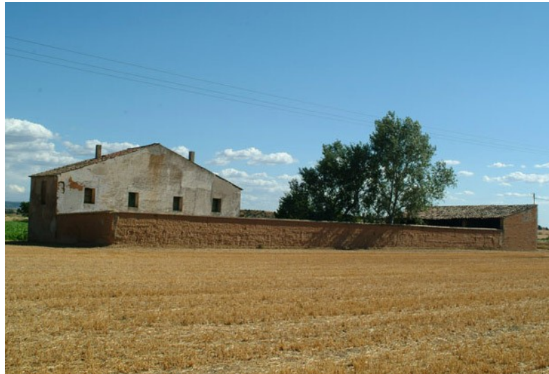
Mas amb cobert i tanca. Construcció de tàpia. Bellpuig (Urgell).

volta de canó -o les seves variants- i el fet d'estar cobertes de terra on l'herba hi creix, si no s'hi ha plantat lliris blaus, que són una bona protecció permanent. Les cabanes de volta gaudeixen de bona temperatura en tota època de l'any. En aquest sentit eren justament apreciades pels que es desplaçaven a peu a més d'un dia de camí i feien nit a les cabanes. També