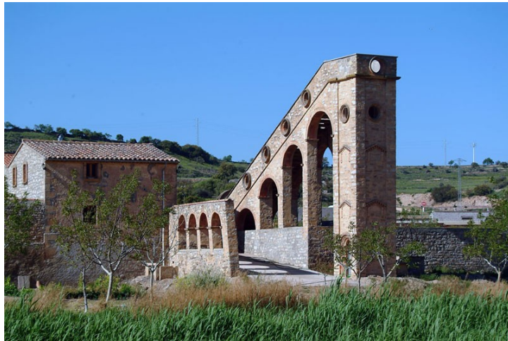
Sitja. Construcció de pedra i rajola. El Talladell (Urgell)

en sitges o botigues , o encara llocs tan inversemblants com el buit de les escales. Després es tornava a la quadra amb tot el necessari per a la setmana. Gairebé no s'anava a comprar, ja que es consumia de la pròpia reserva alimentària. Les reserves més substancioses les proporcionava el porc, del qual es guardava el millor per a l'estiu: pernil i confitat. La cansalada era per