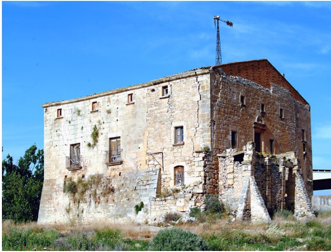
Masia fortificada. Vilagrassa (Urgell).

A l'Urgell i comarques de secà veïnes, després que la fil·loxera arruïnés les vinyes, a finals del segle XIX, el cereal va passar a ser la collita principal. El segar i el batre constituïen el treball més intens, i la vida del poble s'hi subordinava totalment, de manera que al maig els nens acabaven l'escola i tota la família se n'anava a fer vida a les eres, on compartien la feina. Les eres es trobaven fora de les poblacions, encara que les més importants solien estar ben bé