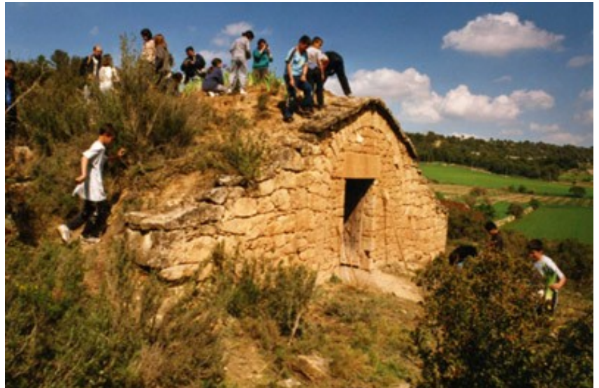
Escolars de les Garrigues plantant lliris al sostre d'una cabana (Els Omellons)

L'objectiu final -potenciar l'estima per aquestes construccions entre els escolars- creiem que es va assolir a bastament, com hem pogut comprovar en posteriors visites, on en retrobar-nos amb escolars que van participar en aquesta experiència vèiem amb bon grat que seguia viva la flama que vam encendre en el seu dia. La creació de nous crèdits per als estudiants d'ESO, que contemplant aquesta matèria, ajudaria a mantenir viu aquest interès i a conèixer millor com va ser la vida dels nostres avantpassats.