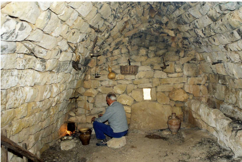
Interior d'una cabana de volta apuntada (Juncosa de les Garrigues)

banda de la cabana per tal de contrarestar l'empenta lateral de la volta. El següent pas era buidar de terra l'interior de la cabana, col·locant-la al sostre, on ben premuda impermeabilitzava l'edifici. El gruix de terra col·locat sobre la cabana li proporcionava, a més, un magnífic aïllament, mantenint la temperatura del seu interior estable al llarg de tot l'any. Seguidament, es construïa la paret posterior i davantera i es feia a l'interior la menjadora de l'animal de càrrega. Per últim, es coronava l'edifici amb un ràfec de lloses que a més de protegir la façana de la pluja, donava atractiu al conjunt de la cabana.